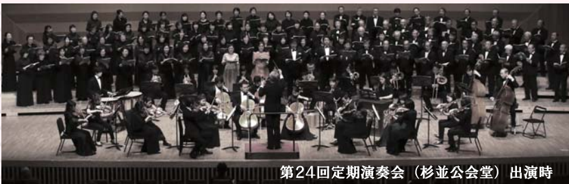
第24回定期演奏会（杉並公会堂）出演時

コンツェントゥス・ムジクス東京 (CMT) は、ピアニストとして、また、管弦楽・オペラ・合唱の指揮者として、枠を超えた活躍を続ける永井宏の類い希な才能と音楽性に共鳴する、若い音楽家を中心に結成された、声楽と器楽のプロ・アンサンブルである。