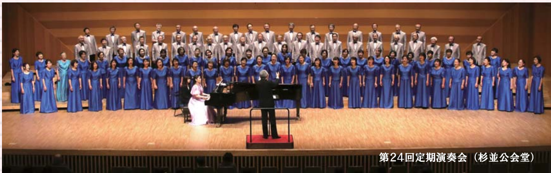
第24回定期演奏会（杉並公会堂）